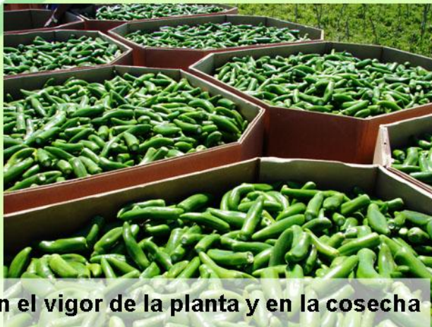
en el vigor de la planta y en la cosecha