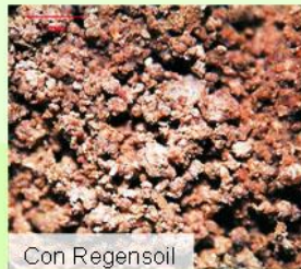
Con Regen soil

Se aplica con cualquier sistema de riego o aspersión. Se evita el triple lavado y el almacenamiento de envases de plástico con residuos tóxicos.